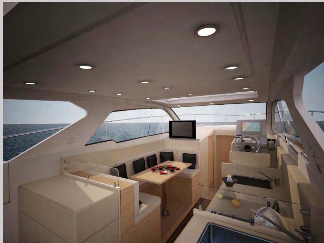
Interior de la cabina