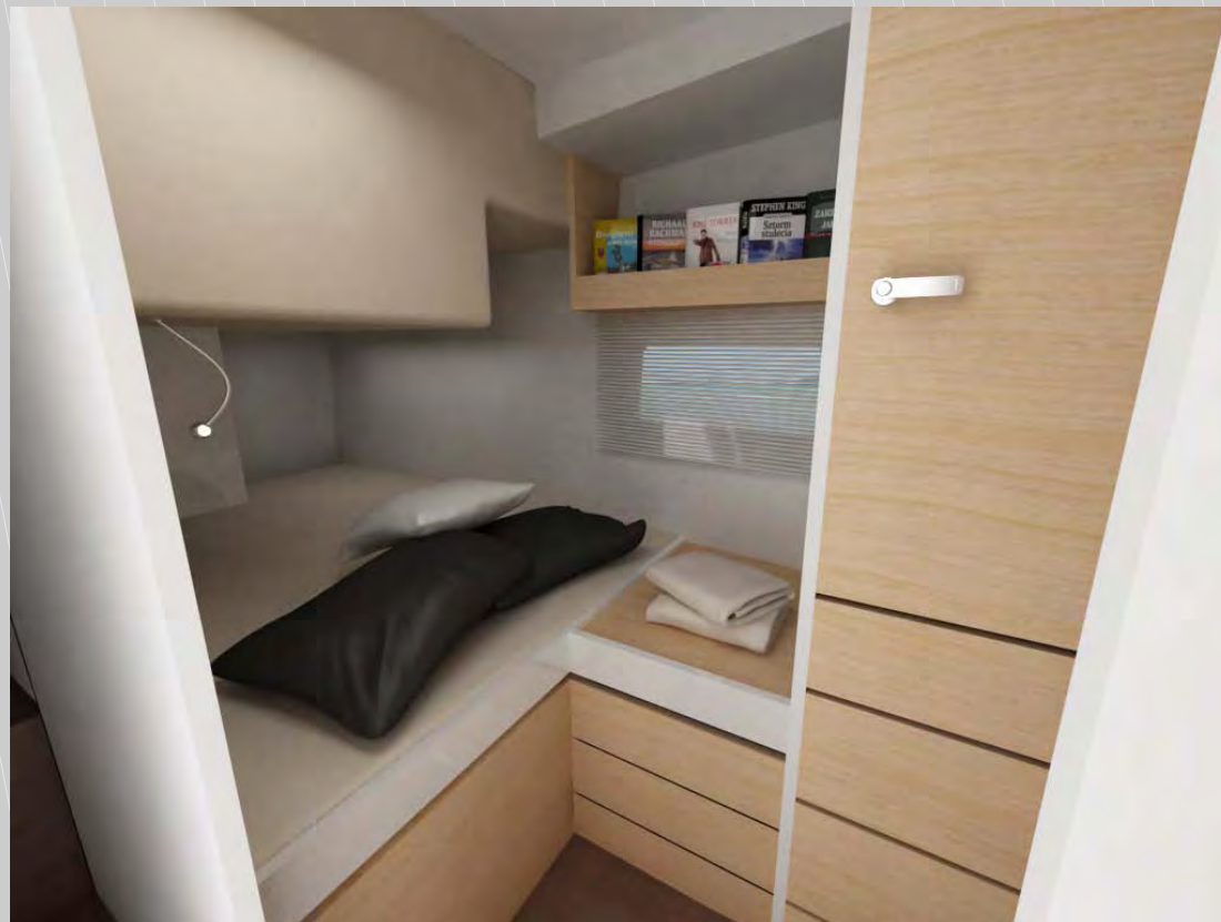
Camarotes principal y de invitados: conserva una amplia cabina logrando gran confort interior.