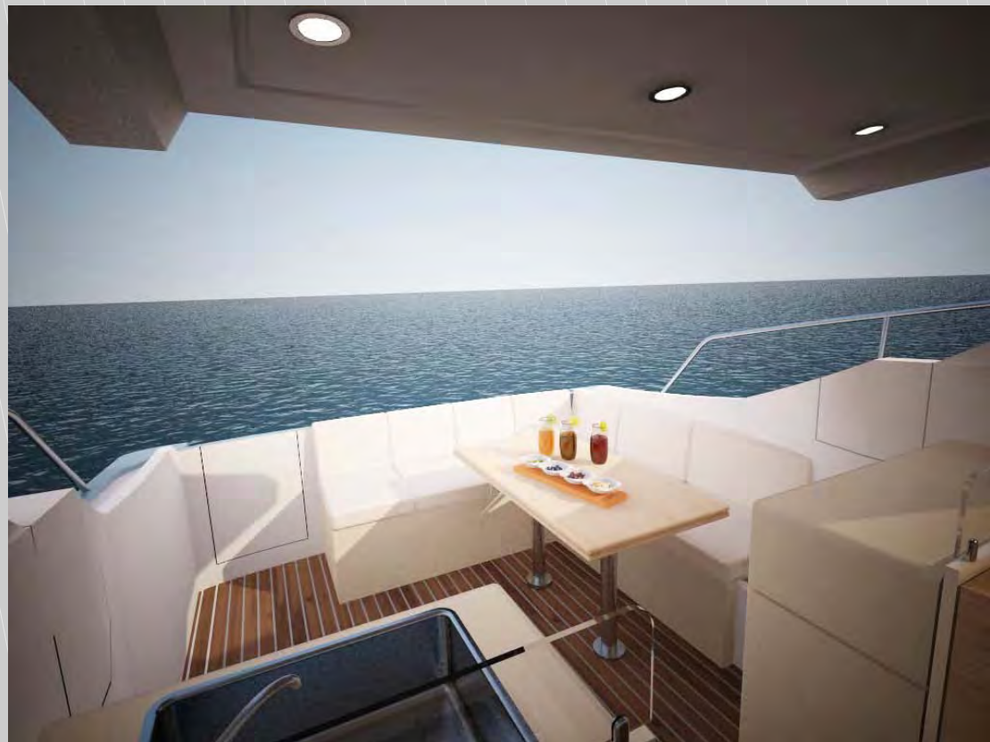
Vistas del copick