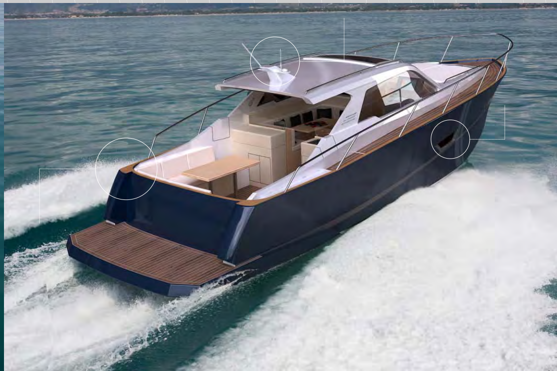
Vista de popa

Este nuevo diseño ofrece un exterior muy funcional, apto para diversiones acuáticas como pesca deportiva.