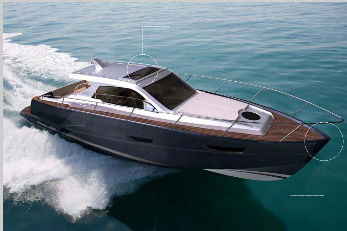
Vista de proa